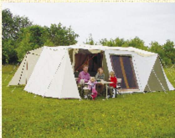
Holtkamper Cocoon met High Tech Tentdak en Achterluifel met zijwanden

High Tech tentdak is schoon te maken met bijvoorbeeld een autoborstel of hogedrukreiniger. Bij warme of koude weersomstandigheden biedt het High Tech tentdak uitzonderlijk veel extra isolatie. Het High Tech Tentdak is (afhankelijk per model) uit te breiden met bijvoorbeeld een keukenluifel of een achterluifel.